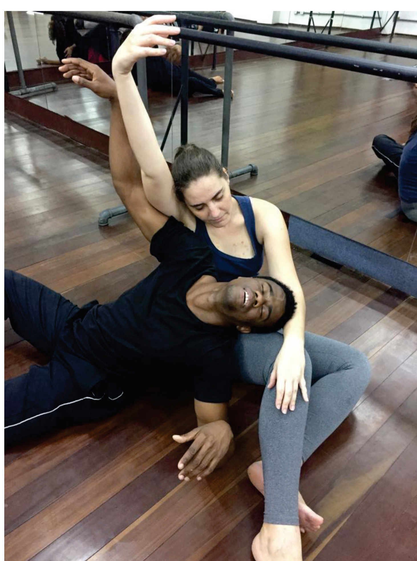
Percepção do peso leve como dinâmica de movimento.

O projeto desenvolve as habilidades corporais e imagéticas do artista criador, que no decorrer do curso compreende que a criação cênica pode partir do seu próprio corpo: investigando a si mesmo, observando os colegas, ganhando autonomia na construção da cena, trabalhando a intenção e a conexão do corpo no espaço cênico.