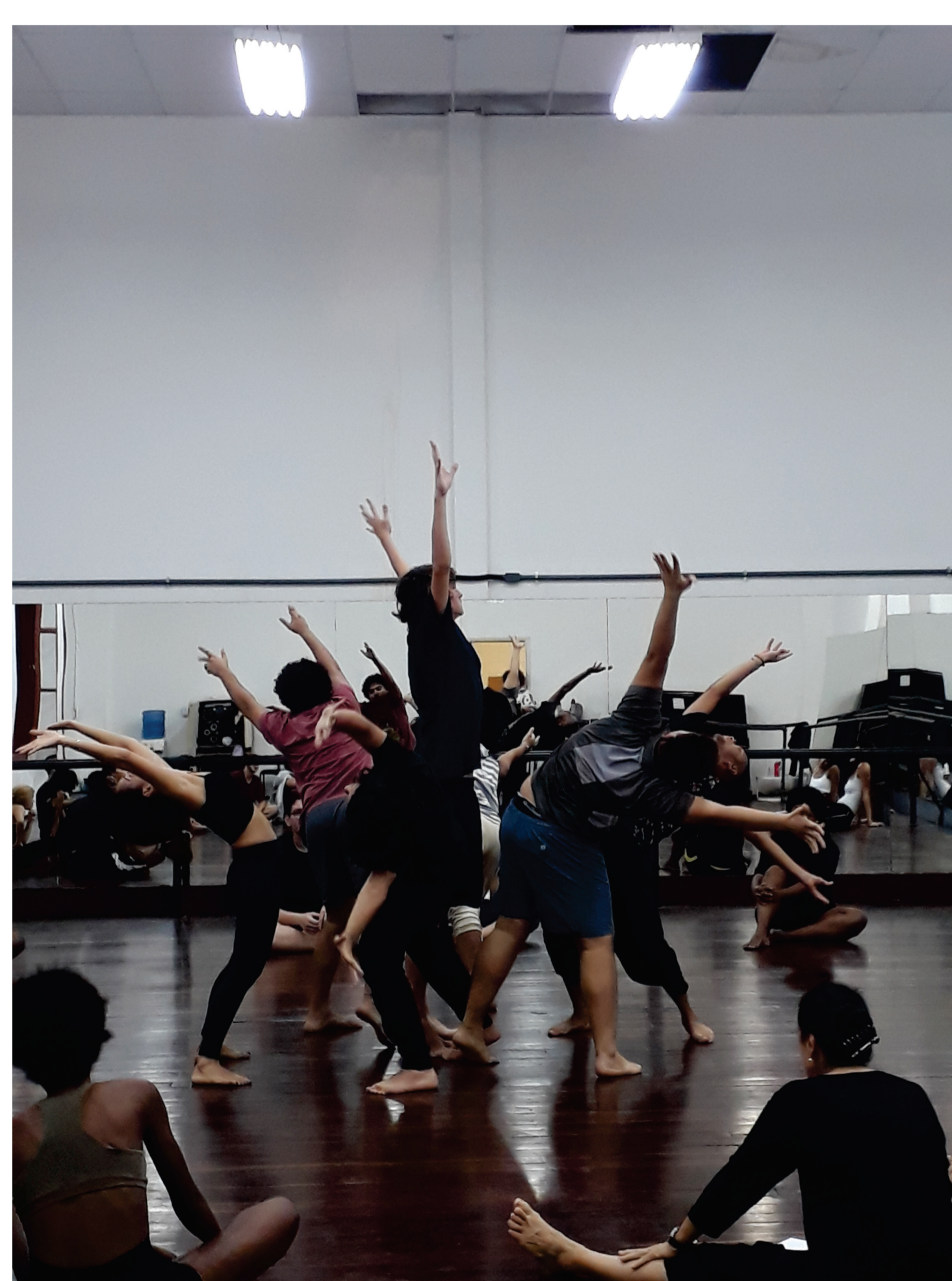
Criação de cena a partir do tema: Irradiação Central.

A partir das propostas de sala de aula e de ensaios, o discente desenvolve a concentração e a escuta, entra em contato com seus sentimentos e sensações através de escritas e desenhos autorais. Trabalha a intenção do corpo no espaço e amplia o seu vocabulário de movimento. Neste processo vai conhecendo a si mesmo, amadurecendo, conquistando autonomia no seu fazer artístico, sempre respeitando seu próprio corpo e suas particularidades.