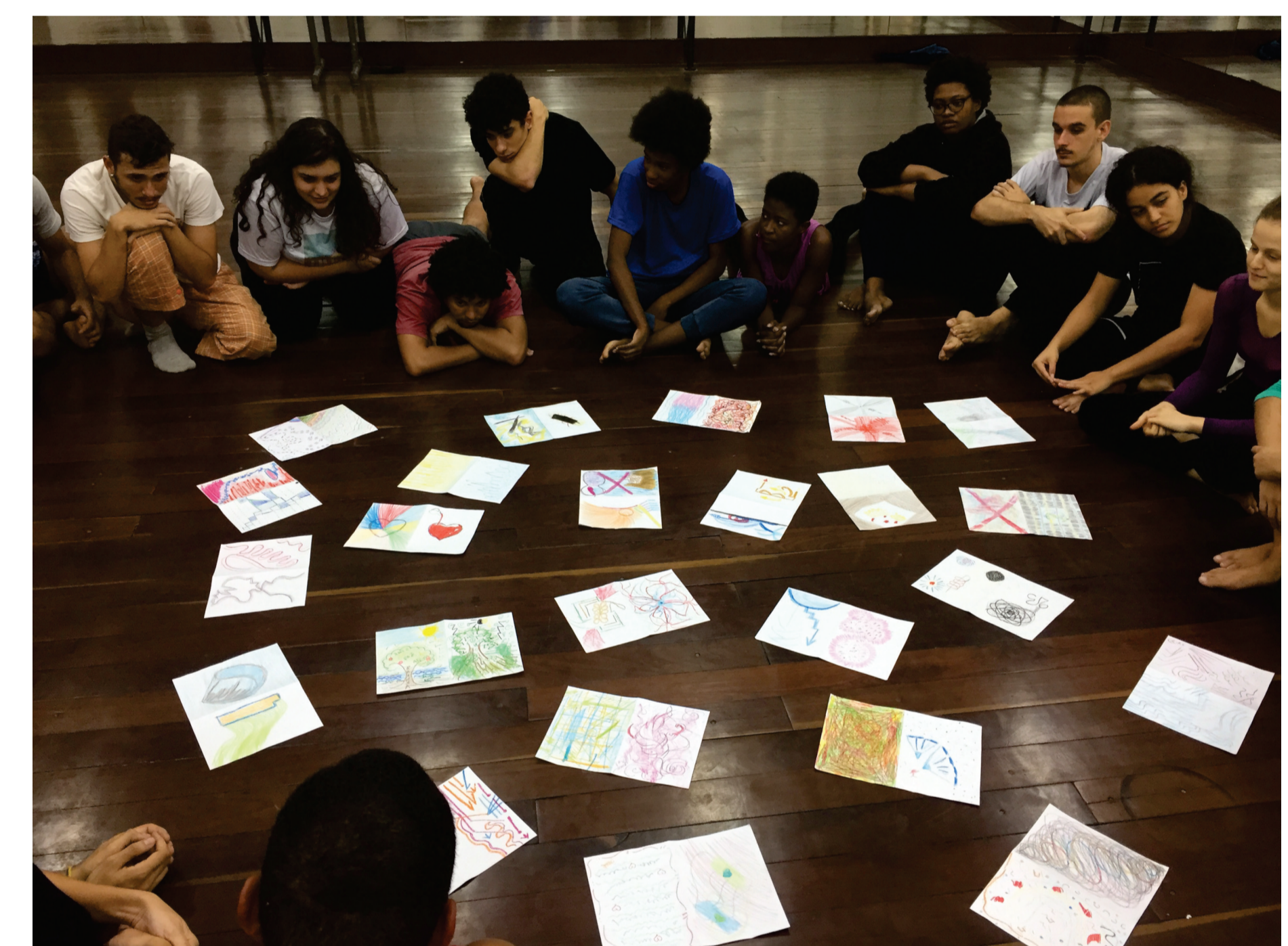
Processo de criação de movimento a partir de desenhos.

A partir das propostas de sala de aula e de ensaios, o discente desenvolve a concentração e a escuta, entra em contato com seus sentimentos e sensações através de escritas e desenhos autorais. Trabalha a intenção do corpo no espaço e amplia o seu vocabulário de movimento. Neste processo vai conhecendo a si mesmo, amadurecendo, conquistando autonomia no seu fazer artístico, sempre respeitando seu próprio corpo e suas particularidades.