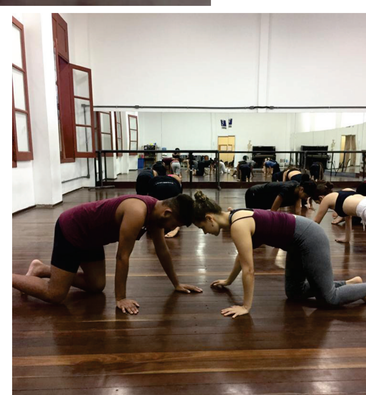
Percepção da Conexão Espinhal.

Através de aulas práticas e expositivas, leituras com temas interdisciplinares, exibição e análise de vídeos, desenhos, poemas, músicas e com pesquisas individuais e coletivas, a análise do corpo em movimento é abordada como propulsor dos processos de criação do ator.